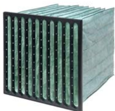
1. Hi-Flo XL