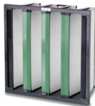
2. Opakfil Green