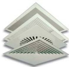
7. FKOP Gitter