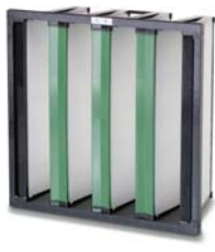
2. Opakfil Green F7