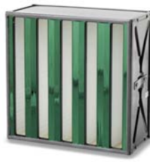
3. Soflair Green H13