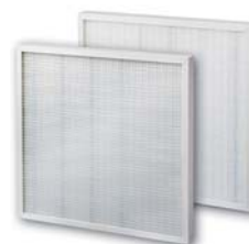
14. Ecopleat F6