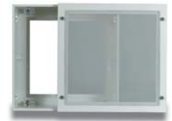
10. Sofdistri Reprise auf Anfrage