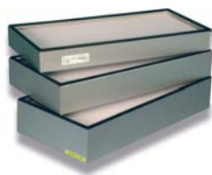
7. Megalam MX MG