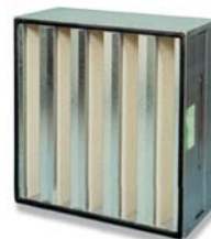
4. Sofilair H13/H14